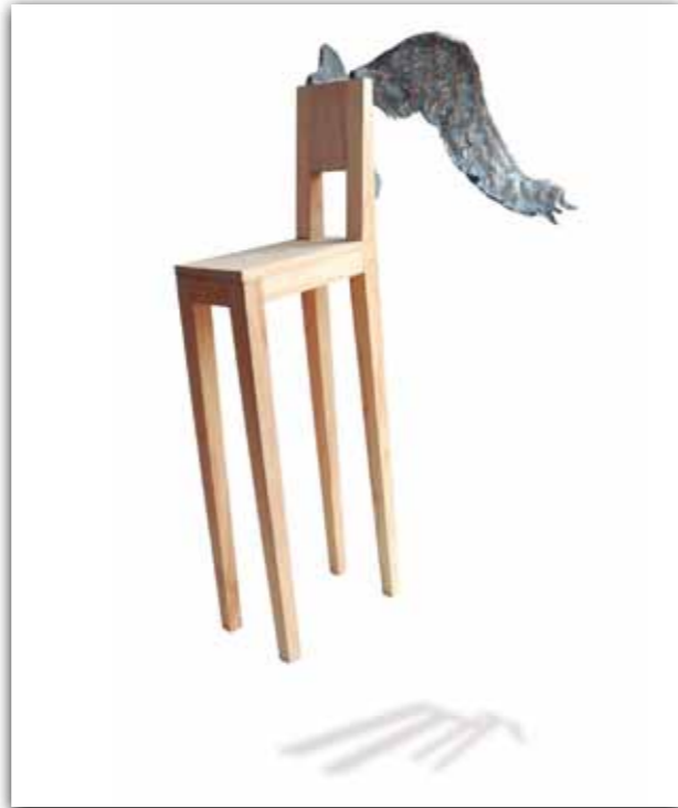
vleugelstoel (2009), gestoomd beukenhout en brons, 120x140x80 cm