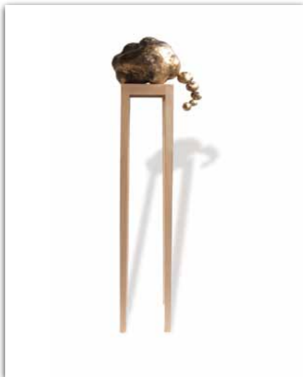
gedachtenballon (2011), gestoomd beukenhout en brons, 180x50x30 cm