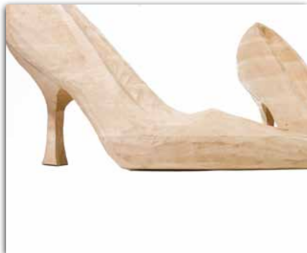
pumps (2010), lindenhout, 110x50x90 cm

Als kind in Brugge had Degraeve al belangstelling voor beeldende kunst en mocht ze graag tekenstift en verfkwaast hanteren. Schilderen bleef lang haar stiel. Toen ze aan de zijde van een Nederlandse man in Nijmegen belandde, kwam het besef dat ze meer wilde. In 1999 schreef ze zich in op de afdeling Vrije Kunst van de Arnhemse Hogeschool voor de Kunsten.