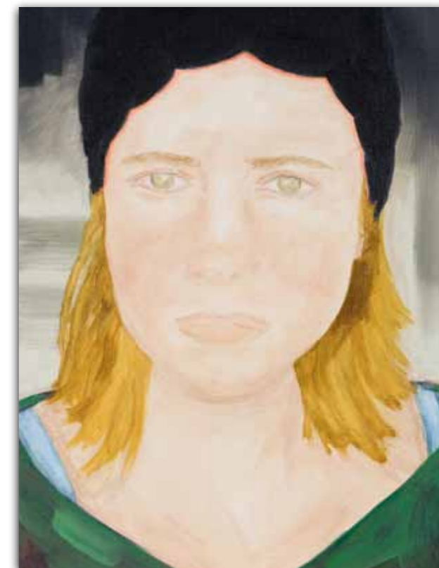
zelfportret (2009), olieverf op linnen, 30x40 cm