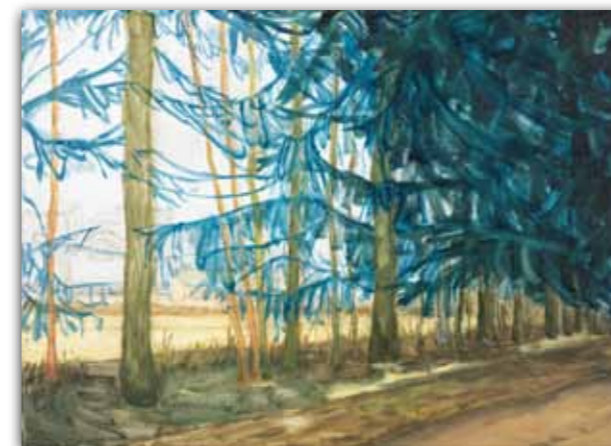
landschap (2010), olieverf op linnen, 45x55 cm