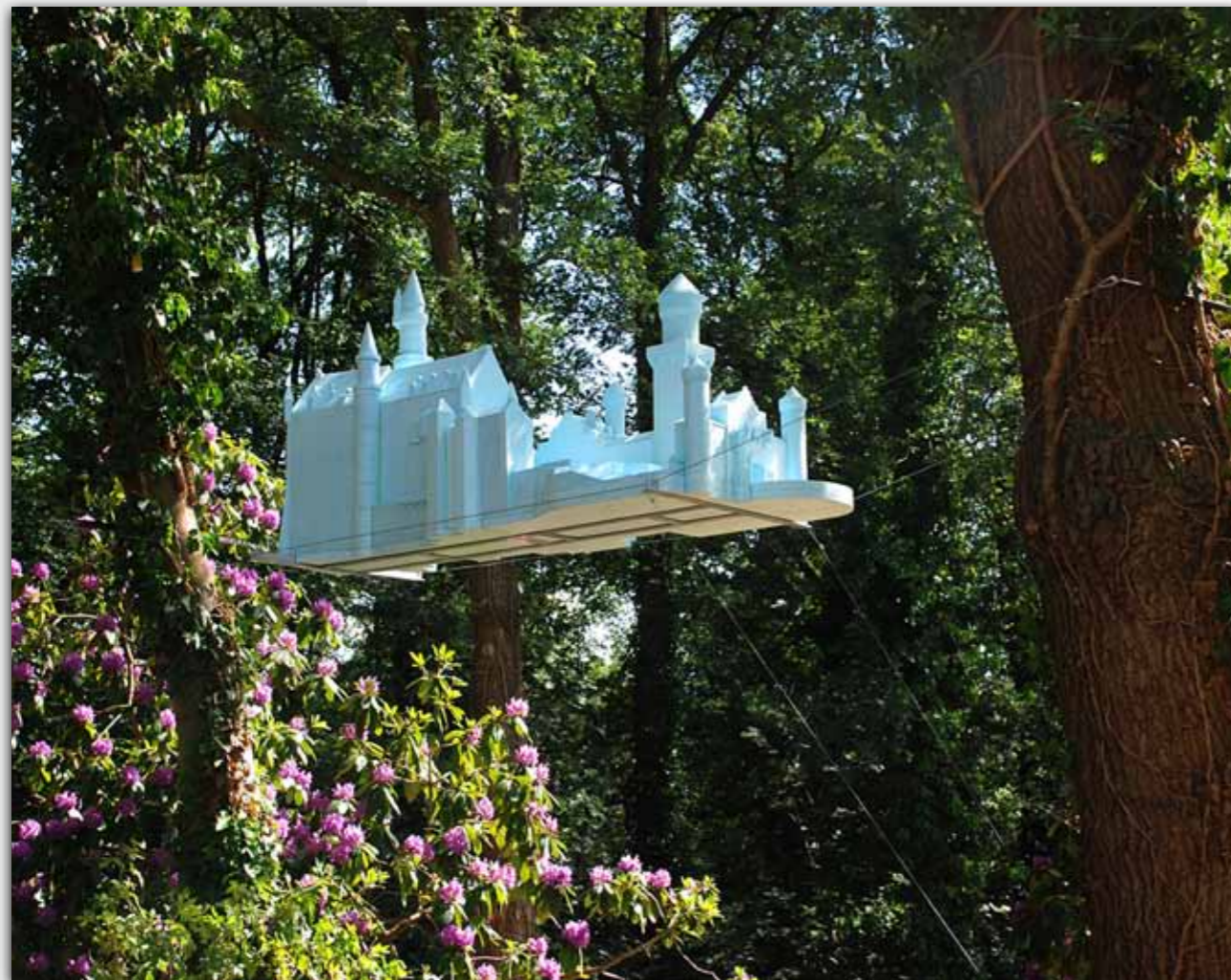
vGtO, blauw schwanstein (2011), styrofoam, 240x125x80 cm

Meld je aan op schuileninhetrijks.nl en kom op zondag 26 juni 2011 naar: