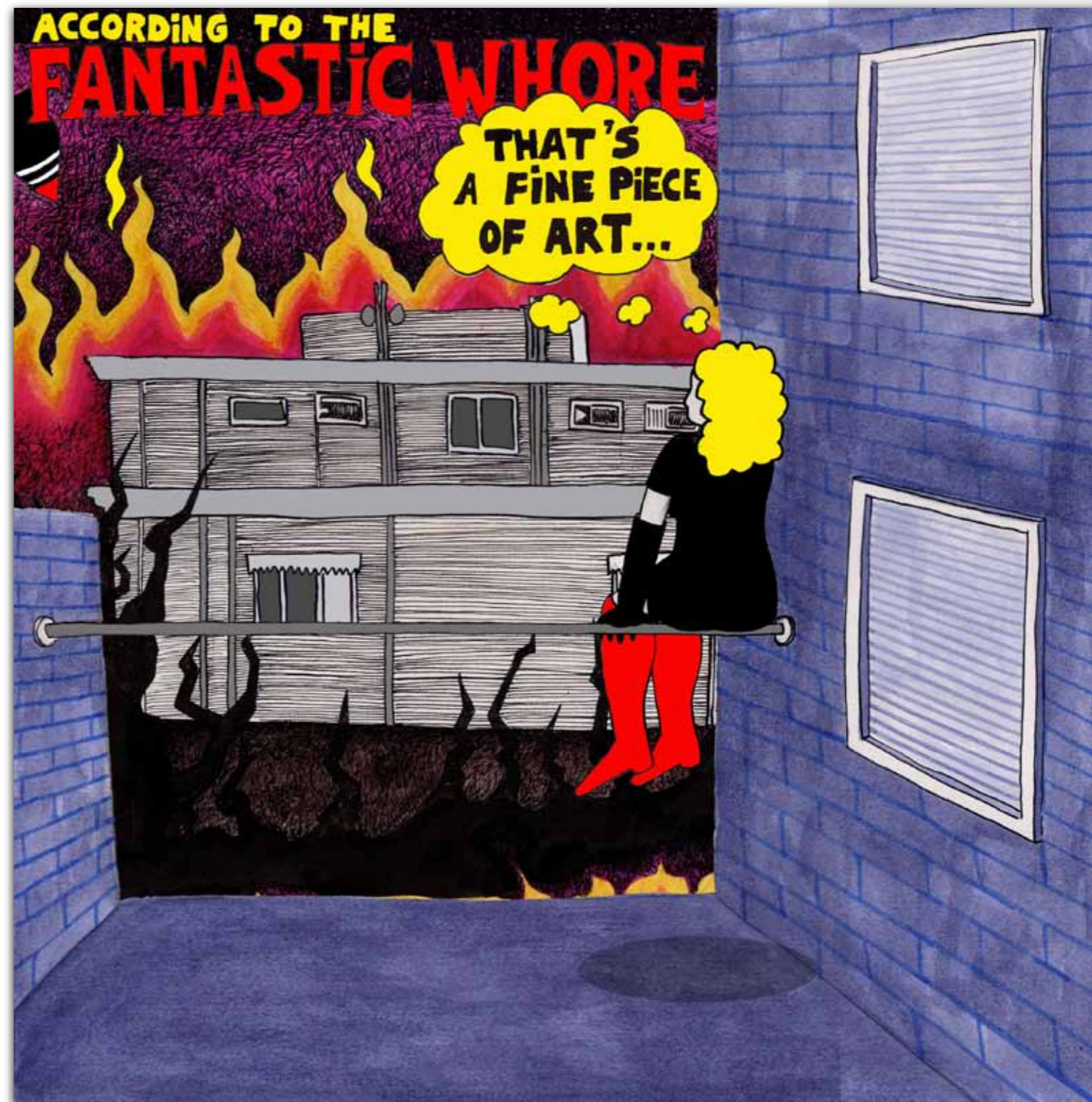
Illustratie door Petra Bouwens (°1978).

Gebruik de GBK als vliegwieltje. Kom zelf met een plan en daadkracht en vraag de GBK om het draagvlak voor je plan te vergroten, het te presenteren aan potentiële opdrachtgevers of mee te denken over financieringsmogelijkheden.