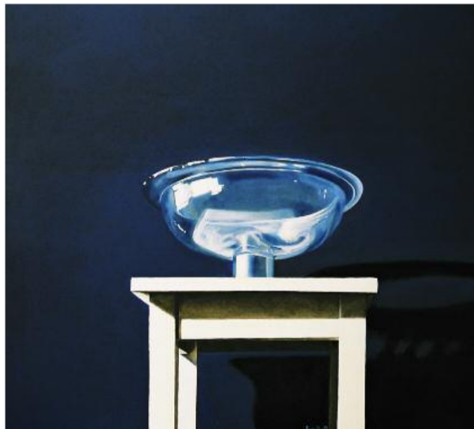
glazen schaal (2006), olieverf op linnen, 100x100 cm.

Hoe verhoudt zijn werk zich tot het werk van die andere realistische schilder van stilleven, Henk Helmantel? Bodt is beslist: 'Ik vind het technisch erg knap wat Helmantel doet, maar verder heb ik er niet zoveel mee.' Hij draait zich om en wijst op een schilderij met een aardewerk schaal op een roodwit gestreept kleed, dat bijna gewichtloos lijkt te zweven in een verregaand geabstraheerde compositie. 'Het is bij mij altijd een beetje vreemdend. Dat zoek ik bewust, ja. Als je naar mijn tekeningen uit de jaren zeventig kijkt, dan hebben die ook iets surrealistisch. Dat surrealistische vind je nu weer terug in mijn stilleven.' Met een bijna verontschuldiggende schouderophaal: 'En het moet een klein beetje esthetisch zijn, hè. Je mag het tegenwoordig al bijna niet meer zeggen, maar ik wil er wel een mooi plaatje van maken, zo simpel is het.' Dat kan over een jaar dus heel anders zijn. Ben Bodt voelt het immers weer kriebelen. 'Ja, ik ben op zoek naar een nieuwe uitdaging. Je moet als kunstenaar wel gevoed blijven, vind ik. Het moet spannend blijven. Ik kan niet precies vertellen wat het gaat worden. Ik ben niet zo goed met woorden. Dingen overkomen je. Maar ik hoop wel dat het lukt. Ik hoop het echt.'