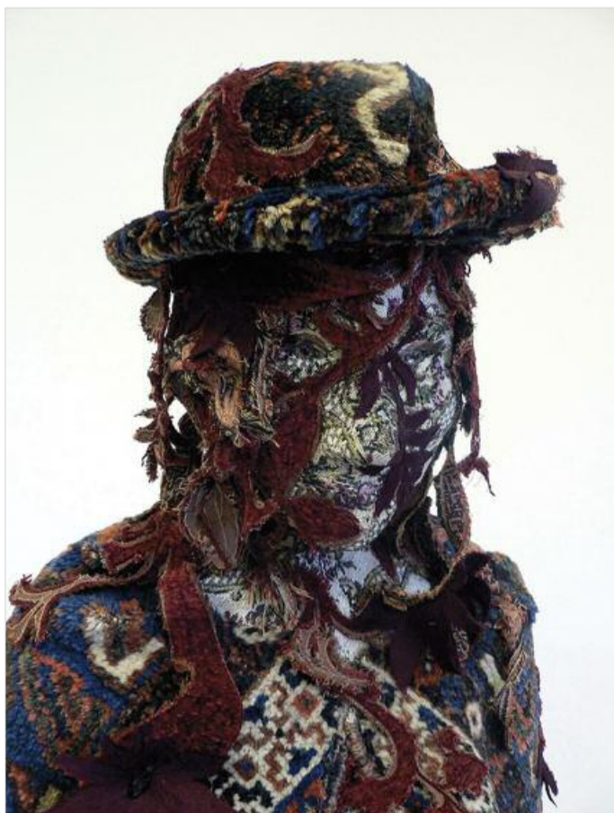
vrouw met hoed (2007), mixed media, 110x65x65 cm.