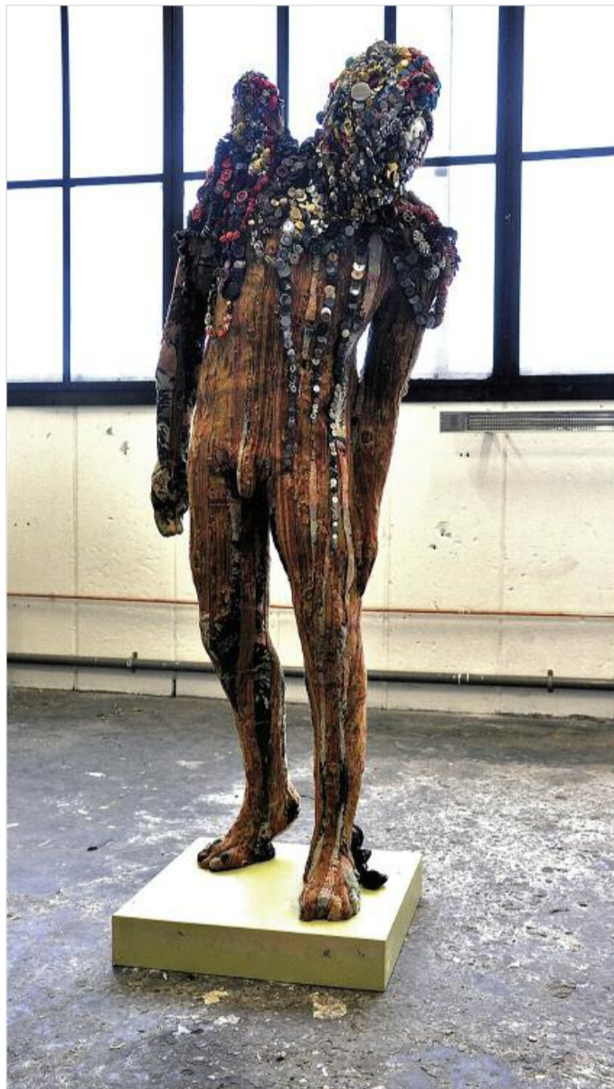
strijder (2009), mixed media, 195x50x55 cm.