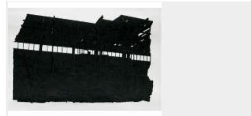
Heidi Linck, rich people having fun #2 (2010), tekeningen van inkt op papier, 64x96 cm.

ringen en reacties op gang die samenhangen met de maatschappelijke, economische en politieke situaties". Het gebruik van licht en donker en incidenteel geluid is in haar installaties essentieel, omdat die de leegte van een ruimte benadrukken én opvullen zonder zelf fysieke massa te bezitten.