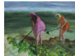
Maaike Sietzema, summer job I (2011), acryl op linnen, 90 x 120 cm.