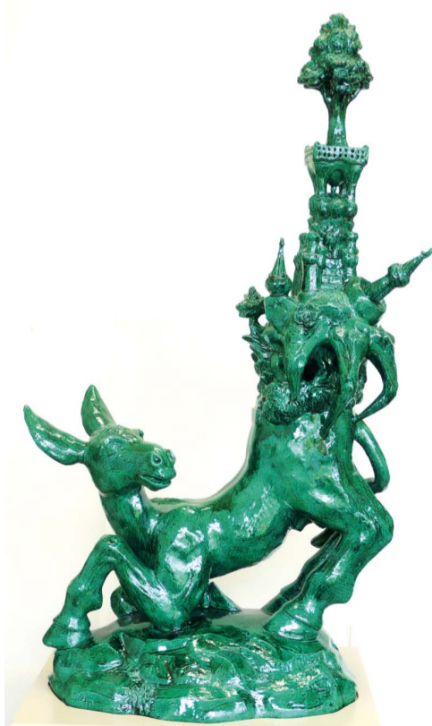
Paradise lost 2008, keramiek geglazuurd, 112cm, 2008