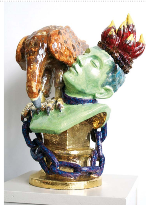
Prometheus, keramiek geglazuurd, 53 cm, 2008